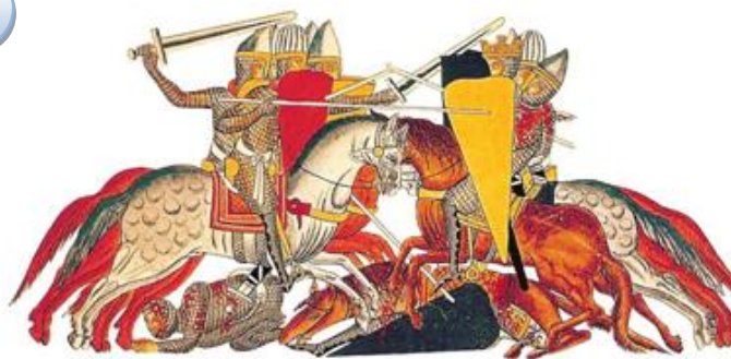
Miniature montrant une bataille de chevaliers, XII ème s.