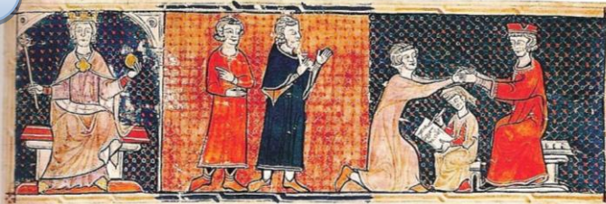
Scène d'hommage au roi de France en 1304. Miniature, Les Grandes Chroniques de France vers 1400.